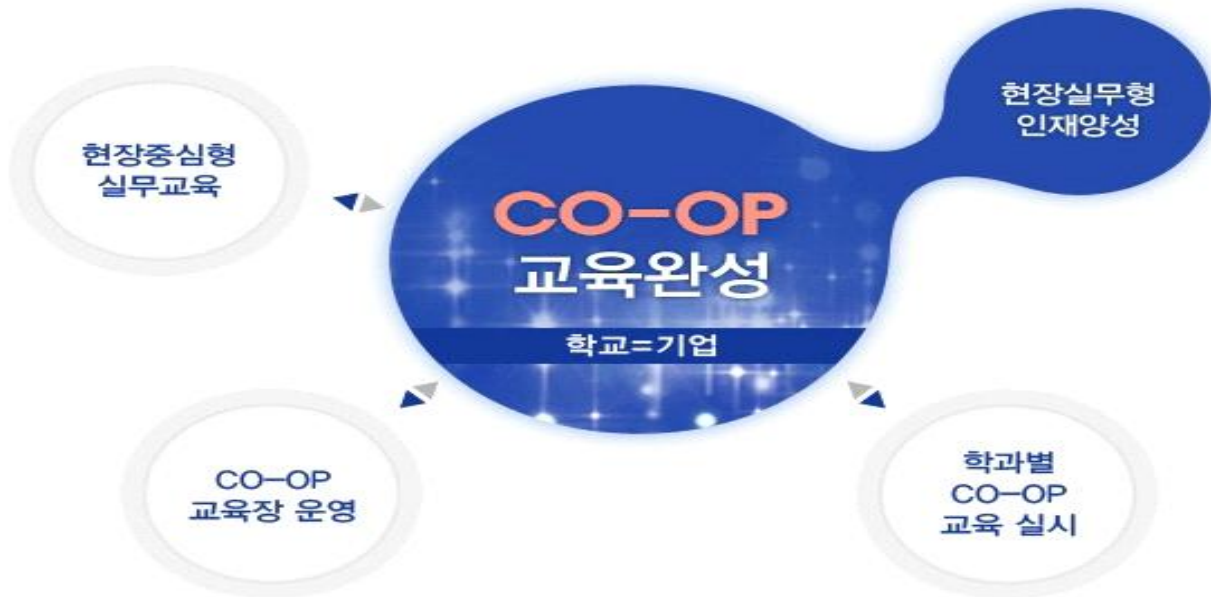
산학일체형 CO-OP교육의 체계도